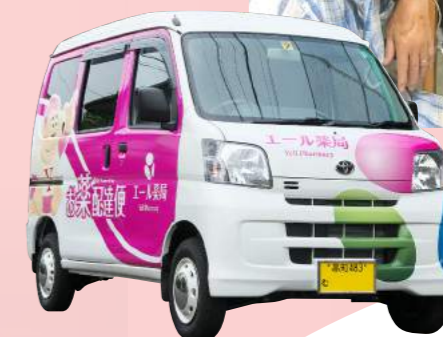
在宅専用車 「エール号」